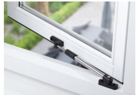
Afbeelding telescopische raamuitzetter

Op verzoek van meerdere bewoners plaatsen we bij elke woning in de slaapkamers telescopische raamuitzetters. Deze steken niet uit naar binnen. Zo kunt u eenvoudiger zelf horren plaatsen, als u dat wilt.